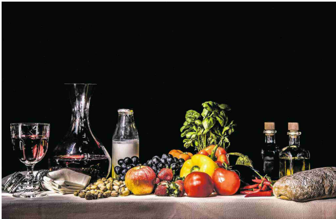
Eine schöne Maxime: Wenn wir schon essen müssen, warum nicht mit Vergnügen?