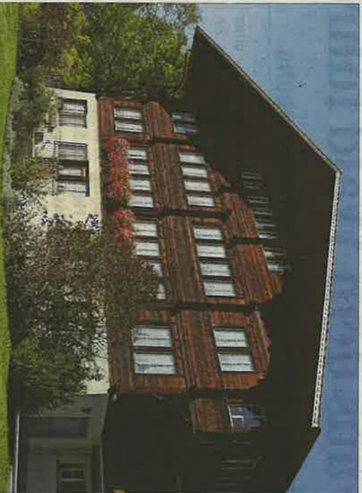
In der Nähe des Schulgebäudes im traditionellen Chalet-Stil kommt ein moderner Laufstall zu stehen.